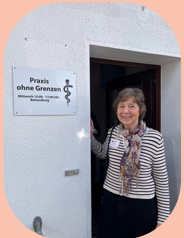
Foto: Edda Rönnau-Jahn, stellv. Vorstandsvorsitzende des DRK Ortsverein Norderstedt e.V.